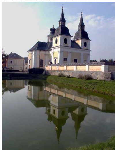
Kostel sv. Václava ve Zvoli na nejkratší cestě mezi Adamovem a Veselíčkem.

Někdy koncem dubna, počátkem května, se uskuteční cyklistický výlet po pozůstatcích činnosti Giovanni Santiniho v okolí.