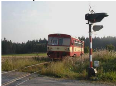
Místo nad zastávkou, asi 400 m od obce, kde trať kulminuje. Na obr. regulérní vlak Nové Město – Žďár n.S.

Železniční stanice Veselíčko je nejvýše položenou zastávkou na trati Praha-Brno. Bývalý bordel (nyní hospoda u „Melicharů“) byl skoro na půl cestě.