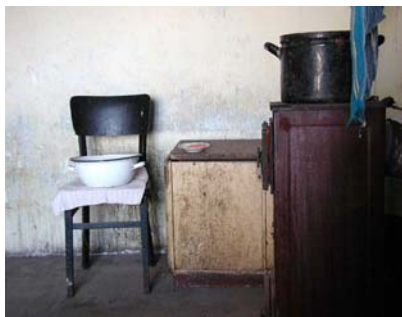
Zátiší ve dvojce na podzim 2002

Za účelem jednoznačného určení obytných místností s cílem provádění operací v přesně vymezených prostorách a nikde jinde, bylo stanoveno, že od východu, tj. od zahrady, budou označeny pořadovým číslem.