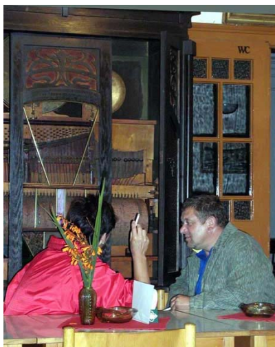
Slavný orchestrion zakoupený ve Vojnově Městci v roce 1922.