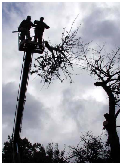
Příprava třešně pro umělecké dílo loni na podzim. Vlevo na plošině Petr Jelínek, Zas. host.

Adamovský sochař, Láďa Nečas, provede v torzu třešně (ca 2,5 m) své nové umělecké dílo. Na toto dílo mu bude zakoupena elektrická řetězová pila, pro chvíle rozvahy mu bude připravena dýmka, doutníky a balené cigarety. Tato umělecká akce bude kulminovat v sobotu 15. března 2003.