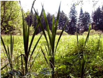
Pohled na centrální část rezervace

1.6.2003 byla založena rezervace „Veselské mokřadlo“. Rozprostírá se asi 1 km na jih od místní hospody a zahrnuje cca 12 ha, na nichž jsou dva rybníky, potok a specifická rašelinná vegetace. Plánovaná těžba rašeliny byla zde okamžitě a přísně zakázána.