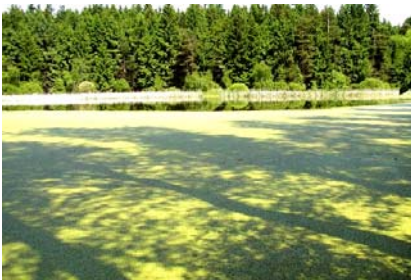
Rybník, v němž jsem se týden před založením rezervace ještě koupal