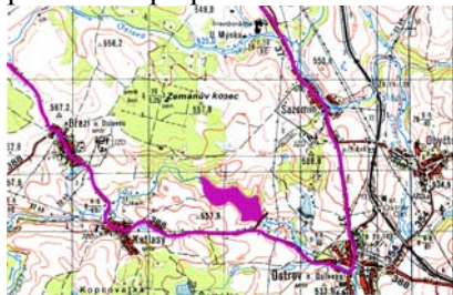
Lokalizace obcí Obyčtov a Ostrov, fialově - nová koupací přehrada

Východní sakristie je nepříjemně narušena zvonící, která byla přistavěna po požáru v roce 1907