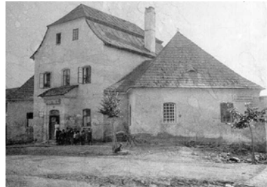
První dochovaná fotografie

Santini obvykle budoval nejdříve zázemí pro dělníky (doloženo i ve Žďáře) a teprve potom se věnoval sakrálním kultům. Půdorys je založen na písmenu W (Václav Vejmluva, viz též Veselíčko). Památka je bohužel nenávratně narušena totálním odstraněním všech detailů fasád.