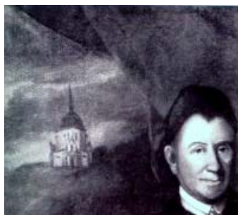
Detail podobizny opata, v pozadí s poutním kostelem na Zelené hoře

učila němčina a latina, bez níž se barokní humanismus neobešel. Významné místo měla kupodivu i čeština. Akademie zanikla krátce po opatově smrti v r. 1740 a za jeho nástupce již nebyla obnovena.