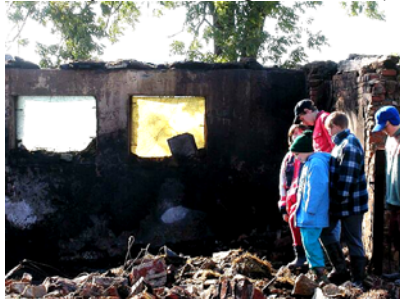
Druhý den ráno – zůstala jen barevná okna

Při volbě osadního výboru na Veselíčku 29.12.03 referoval v rámci svého téměř dvouhodinového monologu starosta města Žďáru Brychta o způsobu práce s požáry. Z toho vyplynulo, že požár je lépe nehasit, celý objekt nechat pěkně vyhořet, neboť po případném uhašení by mohly nastat problémy: úraz padajícími objekty, nutnost odvozu na skládku těch objektů, které mohly v klidu shořet atp. (Zvážit zda nevyměnit práškový hasící přístroj umístěný v chodbě za plamenomet.)