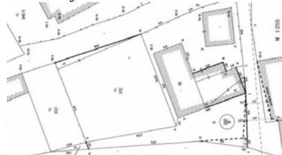
Nové zaměření pozemku (za další peníze). Vpravo dole je patrné jeho okleštění.

Zpočátku byl výměr pozemku značně redukován a posléze, dne 18.12.03, na dalším zasedání zastupitelstva prohlásil: „Na posledním zasedání jsem navrhl revokaci rozhodnutí Rady města, nebylo to RM přijato, proto využívám tuto možnost a navrhuji revokaci dnes.“