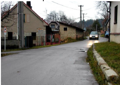
Situace na křižovatce: auto přijíždí od státní silnice Žďár-Bystřice. Nyní má možnost pokračovat k obchodu u Šimů rovně nebo ke křižovatce na Jámy doprava.

Křižovatka bez přednosti v jízdě nacházející se přímo před usedlostí je nebezpečným místem. Nebezpečí nehody je zde zvýšeno tarasem, který si soused Stejskal postavil přímo do křižovatky a zamezil tím možnost vyhnout se vozidel v případě nebezpečné situace. O tomto stavu byl starosta Brychta informován dopisem.