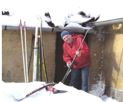
Ouja maže na sobotní výlet. Den předtím napadlo a na dvůr bylo nafoukáno do pasu sněhu. Cesty na dvore a kolem domu jsem prohazoval celý den.

V kruzích běžkařských nadšenců se vedou diskuse o tom, co je to přejezd Žďárských vrchů. Aby to bylo jednou a provždy jasné, toto je tradiční cesta: Žďár, Račín, Škrdlovice, Tisůvka, Cikháj, Žákova hora, Devět skal, Malinská skála, (Blatiny), Samotín, Kadov, Podmedlovský mlýn, Medlov, Tři Studně, Lhotka, Veselíčko. Existují samozřejmě varianty, začátek na Veselíčku nebo do Veselíčka přes Studnici a Maršovice. Jiné cesty je nutno považovat za ilegální.