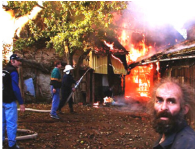
Požár stodoly – viz proud vody z místní stříkačky (v obci již není ani jeden rybník).

Hned za 14 po stavbě záchodu došlo k velkému požáru, při němž se tento objekt podařilo uchránit. Dohnalova stodola (sousedství z jihovýchodu) vyhořela do základů. U požáru jsem byl jeden z prvních, protože jsem si myslel, že to čudí moje kamna.