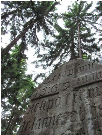
Kdo koho na tomto místě zastřelil roku 1569 jsem již zapomněl.

19.6. byla prozkoumána oblast kolem Vojtěchovské hájenky. Nalezeny oba známé kříže – „lesní stéla“ o věčném zápolení hajných a pytláků.