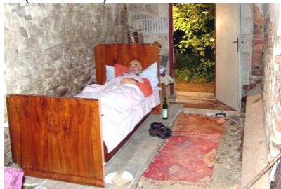
Pohled na sever

V červenci o prázdninách byl zprovozněn letní byt obsahující dvě křesla, stůl a postel. Výstup z „bytu“ je možný na dvůr nebo na zahradu. Na zimu bude postel zrušena a nahrazena skladem dřeva a šišek s krátkým dosahem. Kolem postele vede, v noci plně osvětlená, spojovací cesta {dům-WC}.