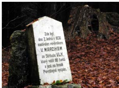
Na vycpanou vlčí postavu si ještě dobře pamatujeme ze školních výletů na hrad Pernštejn v šedesátých letech. Z důvodu zplsnivění byl tento již dávno odstraněn

Poslední podzimní cyklistický výlet se konal do oblasti výskytu posledního vlka na Vysočině, na něhož si ještě dobře pamatují ze školních výletů na hrad Pernštejn. Z důvodu zplsnivění byl již dávno odstraněn.