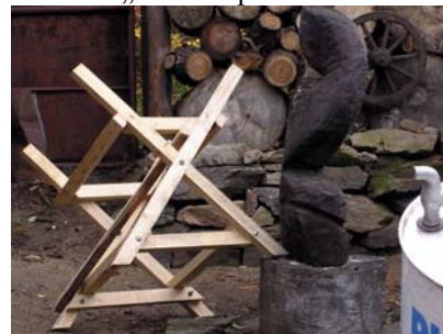
Vlevo koza, vpravo sud, vana je již ve stodole, sifon v nářad'ovně. Na ztvárnění letní koupelny bude vypsána soutěž a její provoz bude zahájen slavnostním prvním umytím některé z ženských celebrit.

Dalším účelovým objektem stejného autora je „koza“, která bude součástí instalace „letní koupelna“.