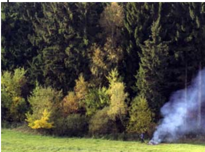
Jirka Raška u asanačního ohně. Les v majetku usedlosti čítá 8 stoletých smrků, enormní břízu a další stromy (viz obr.) pocházející převážně z náletů.

V rámci letošní extenzivní houbové sezóny (nalezeno hub pro tři osoby na týden) byla se Zuzanou Michálkovou a Jirkou Raškou provedena (po 10 letech) údržba lesa v majetku usedlosti. Všechno suché a shnilé dřevo bylo vytaženo z lesa a buďto hned na louce spáleno nebo na spálení odvezeno.