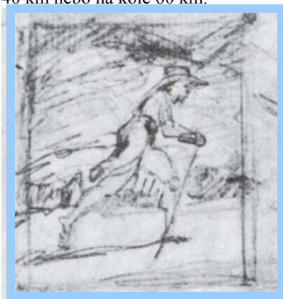
Kresba „Pocestný“ Williama Blakea bude součástí čestného diplomu.