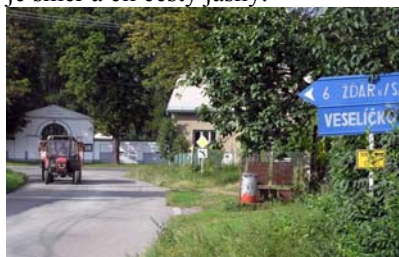
Prostě od hřbitova doprava

Pokud jedete od Jam. I když, proč byste jezdili od Jam. Kdybyste zabloudili do Jam, třeba traktorem, je směr a cíl cesty jasný.