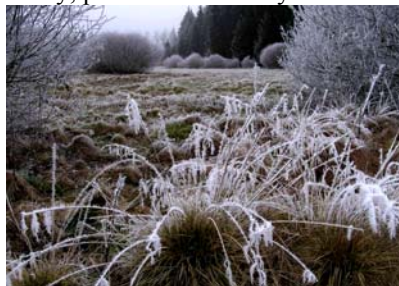
Rezervace Veseličské mokřadlo – stav v období Vánoce-Silvestr 2004

(kolem 1500 m über m). Stav tratí dobrý, počet běžců mizivý.