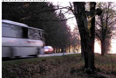
Golden Lord of the Road

Tedy: z Nového Města je příjezd z křižovatky na jihovýchodě od modré tečky. Není značená. Pokud na levé straně silnice (v poloze modré tečky) uvidíte Pána silnic (viz foto), pak jste ji už přejeli a musíte odbočit - cha, cha - až u Mělkovic (zelená tečka).