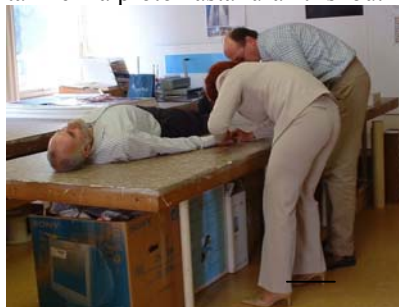
Úraz se dostal až na provizorní operační stůl, kde byl ukončen dvojicí zkušených a zodpovědných spolupracovníků

všechna pracoviště jsou vybavena varovnými tabulkami. V lese tomu tak není a proto nastal úraz třískou.