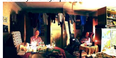
Meditační prostor je na usedlosti všude: zvláště se daří ve dvojce, trojce, u kulečníku a v letním bytě

Co by z nás bylo bez meditace. Bez zvnitřněného zopakování prožitků, pocitů, myšlenek... Tuto situaci zachytil fotograf peter sonenberk následující dvojexpozicí: