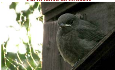
Pták na kadiboudě