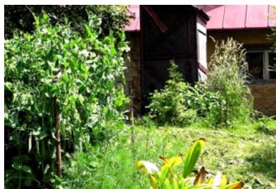
Zahrada předkadiboudová se 2 tujemi, jasanovým náletem (zcela vpravo) a za kvetoucím hrachem. Ocuňy v popředí jsou na tom naopak dost bledě