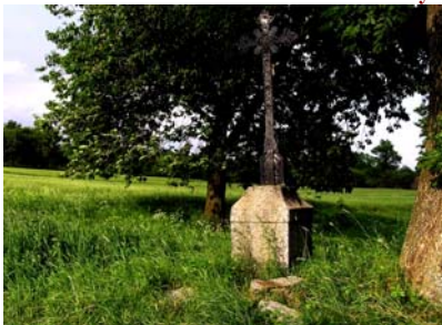
Žula nahrazena litinou