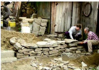
Stavba kamenného bezbetonového tarasu. Snad jen díky vysílení z této práce zasáhli vyobrazení borci do bojů jen o druhé místo biliárového finále

Ani ta se nezanedbává: Největšími letošními akcemi bylo rozdělení dvora na vyšší a nižší a příprava opěrných pilířů a terénu pro stavbu plotu kolem zahrady (provede Dilo Svratouch).