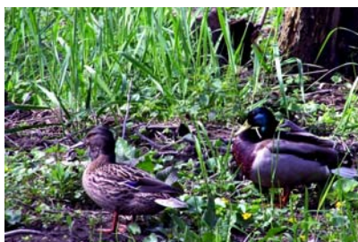
Párek kačen na Rohance

Na začátku května se na naší louce „Na Rohance“ usídlil párek kačen. Protože se zde chovali jako doma, bylo je možno označit za domácí. Podobně jako dosud neidentifikovaného ptáka, který prožil mládí v bezu u DC a později si dělal nárok na celou zahradu a celý dvůr. Jeho práva mu ovšem nemohla být upřena (my se zde nenarodili).