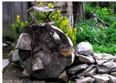
Autor objektu: Radek Tejkal

V této pravidelné rubrice dnes představujeme objekt „Daliho hodinky“ instalovaný naproti letnímu bytu. A „Odine, spi nad námi!“ instalovaný na torzu třešně.