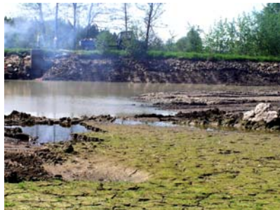
Neuspokojivý stav koupaliště tehdy nemusí být takovým nyní

Oblíbené „koupaliště“ mezi Lhotkou a Jiřkovicemi se čistí. Zhruba metr výšky jde na pole. Proto byla provedena sólová výzkumná výprava, při níž bylo probádáno tucet rybníků v okolí do 10 km od usedlosti.