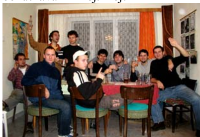
Členové spolku vlastníků: jeden nahoře vlevo, druhý dole vlevo, třetí byl vykázán a odjel přespat do Adamova

Teprve nyní bylo zjištěno, že největší kastrol na usedlosti se blíží propálení. Způsobilo to zřejmě vaření guláše pro níže uvedenou společnost. Pokud dobře počítám, šlo zde o večeri pro minimálně devět lidí. Na dalších neuvedených fotografiích je zřetelně patrný předmět doličný a ochutnávání z něj. Hej!