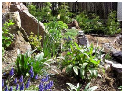
Zahrada předstodolní se šesti tujemi

Činnost v domě, kterou lez letos označit věru za liknavou, byla nahrazena činností na dvoře a na zahradě. Květinová zahrada předdomí, předstodolní a předkadibudková jen kvete. Navíc byly osazeny osmi tujemi, šesti různobarevnými šeříky a dvěma zakroucenýma vrbama.