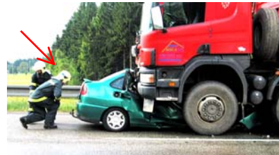
Náš les začíná křovím (viz šipka). Další komentář není třeba