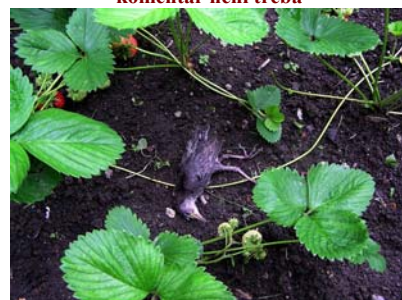
Ani zde není jasné, co se vlastně stalo. Smrt v jahodách je snad útešnější než smrt na silnici, která se děje mnoha ptákům i lidem